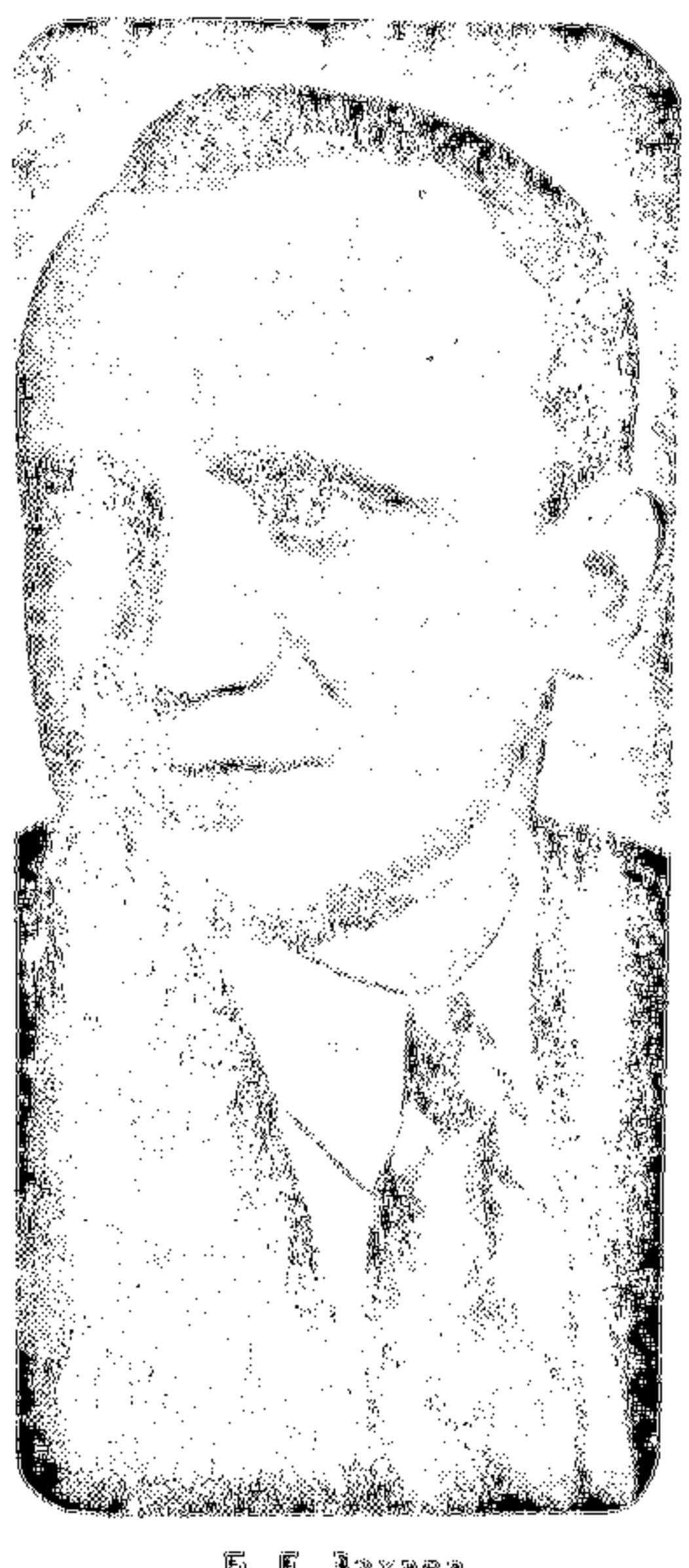
Б. В. Захава